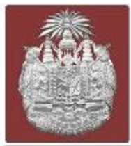
ส.ก.วิหารแดง